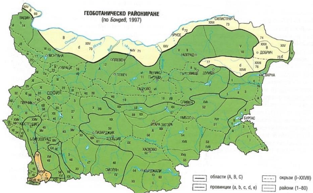
Фигура 2-2. Геоботаническо райониране (по Бондев, 1997)

(Фигура 2-2). В местообитанията на ТПП „Персина“ има значително флористично и фитоценоотично разнообразие, като на територията на парка са установени находища на растителни видове с природозащитен статус. Значително флористично и фитоценоотично разнообразие има и на територията на общината включена в ЗЗ „Никополско Плато“. Състоянието на преобладаваща част от местообитанията на тревните и храстовите съобщества в общината се оценява като относително нестабилно, което е следствие на различни форми на антропогенно въздействие. Общото състояние на местообитанията на горските съобщества, които са свързани с различни насоки на протичащите първични и вторични сукцесии, се оценява като средно. На съществуващите черни пътища са формирани фрагменти от вторични плевелно-рудерални съобщества, които са свързани с различни насоки на протичащите вторични сукцесии. В съседните на пътищата територии преобладават растителни съобщества от клас Festuco-Brometea .