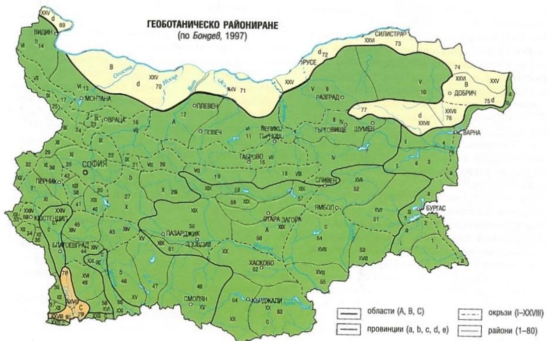
Фигура 2-2. Геоботаническо райониране (по Бондев, 1997)

(Фигура 2-2). Значително флористично и фитоценотично разнообразие има и на територията на общината включена в 33 „Никополско Плато“. Състоянието на преобладаваща част от местообитанията на тревните и храстовите съобщества в общината се оценява като относително нестабилно, което е следствие на различни форми на антропогенно въздействие. Общото състояние на местообитанията на горските съобщества, които са свързани с различни насоки на протичащите първични и вторични сукцесии, се оценява като средно. На съществуващите черни пътища са формирани фрагменти от вторични плевелно-рудерални съобщества, които са свързани с различни насоки на протичащите вторични сукцесии. В съседните на пътищата територии преобладават растителни съобщества от клас Festuco-Brometea .